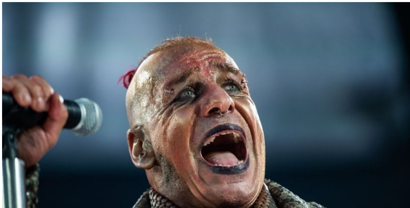
Till Lindemann, le chanteur du groupe de metal allemand Rammstein, accusé de violences sexuelles.